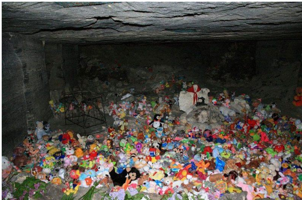
Место, где нашли тела детей

Колодец для подземного гарнизона был вопросом жизни, его местоположение тщательно охранялось, а количество воды и ее расход письменно контролировались. Чтобы колодец не завалило взрывом его подпирали мощные каменные стенки.