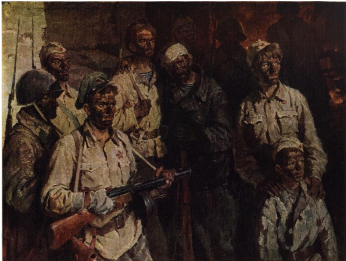
«Солдаты подземного гарнизона». Николай Бут

Каменоломни со времен их обороны в 1942 году разделяют на Малые и Центральные (Большие), они не соединены друг с другом, находятся на расстоянии друг от друга примерно 300 метров. В Малых каменоломнях находилось сначала чуть более 2000 человек. Кроме этих двух гарнизонов в изолированных от них шахтах также размещались военнослужащие, не сумевшие выбраться из окружения. Всего приблизительное количество военных в каменоломнях было свыше 20 тыс. человек.