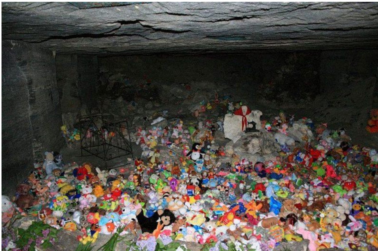
Место, где нашли тела детей

Колодец для подземного гарнизона был вопросом жизни, его местоположение тщательно охранялось, а количество воды и ее расход письменно контролировались. Чтобы колодец не завалило взрывом его подпирали мощные каменные стенки.